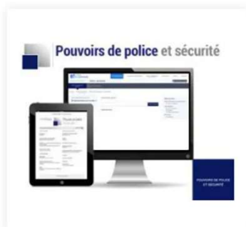
Pouvoirs de police et sécurité 67,00 €