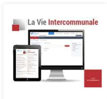
La Vie Intercommunale 95,00 €