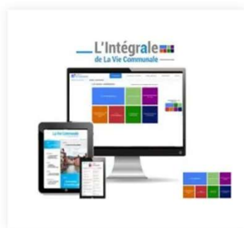
L'Intégrale de La Vie Communale (dématérialisé) 410,00 €