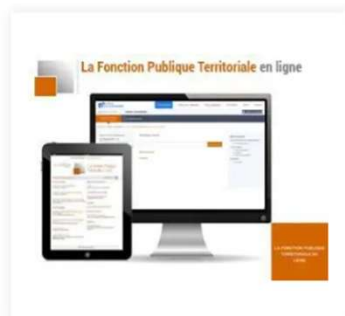
La Fonction Publique Territoriale en ligne 76,00 €