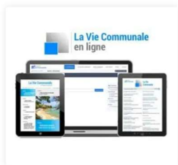
La Vie Communale en ligne 150,00 €