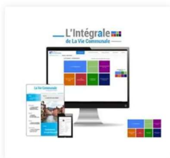
L'Intégrale de La Vie Communale 410,00 €