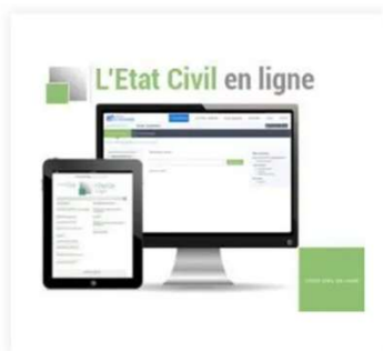
L'Etat Civil en ligne 68,00 €