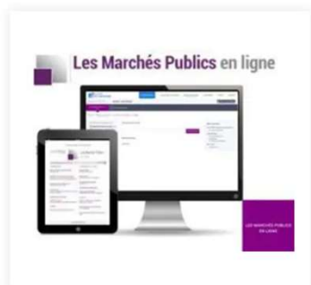
Les Marchés Publics en ligne 73,00 €