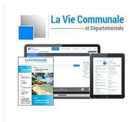
La Vie Communale et Départementale 151,10 €