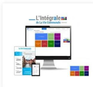
L'Intégrale de La Vie Communale 410,00 €