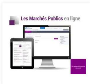
Les Marchés Publics en ligne 73,00 €