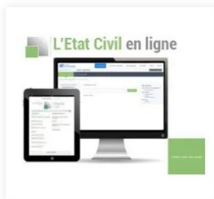
L'Etat Civil en ligne 68,00 €