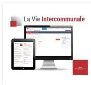
La Vie Intercommunale 95,00 €