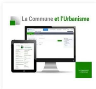
La Commune et l'Urbanisme 79,00 €