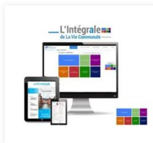
L'Intégrale de La Vie Communale (dématérialisé) 410,00 €