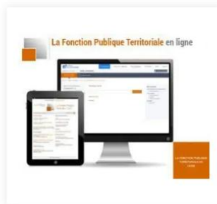
La Fonction Publique Territoriale en ligne 76,00 €