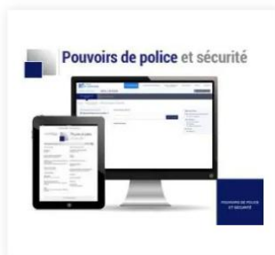
Pouvoirs de police et sécurité 67,00 €