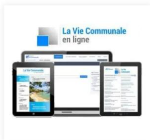
La Vie Communale en ligne 150,00 €