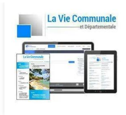
La Vie Communale et Départementale 151,10 €